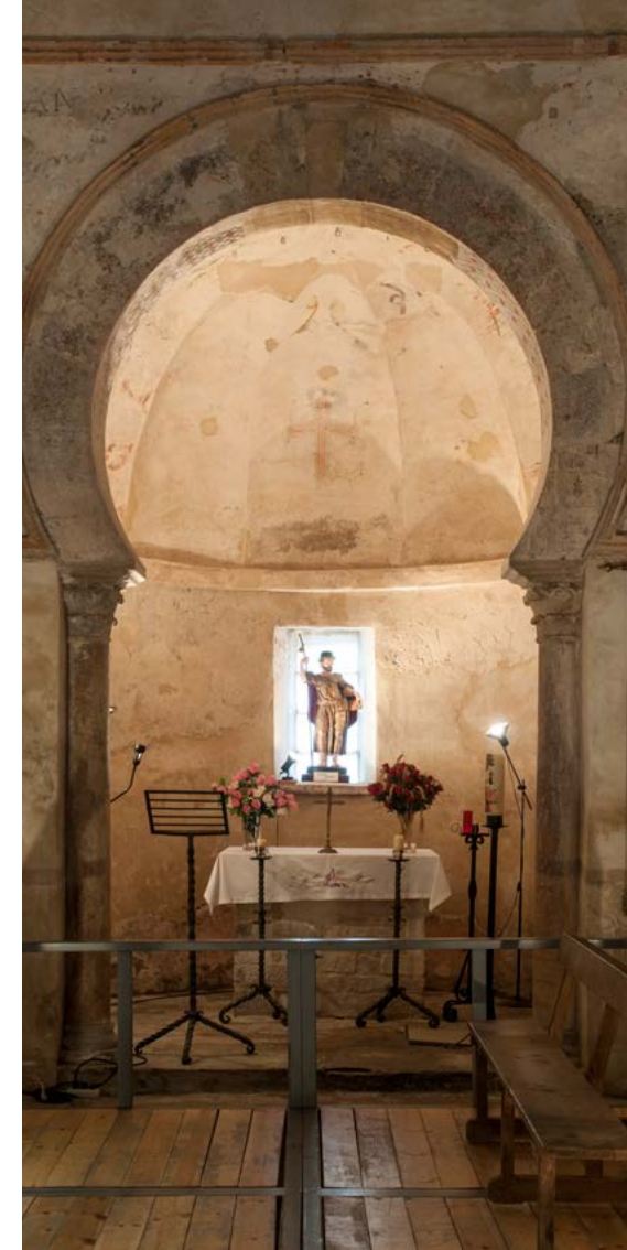
Ábside de cabecera con arco de medio punto, donde se aprecian algunas de las pinturas murales de la iglesia.

En el siglo XII el abad Pelayo manda la realización del Cáliz y la Patena , igualmente de gran valor y visitables en el Museo del Louvre, París.