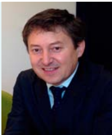
Samuel Folgueral Alcalde de Ponferrada