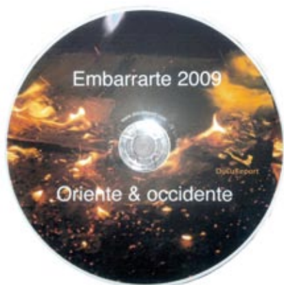
EMBARRARTE 2009 y 2010 de CIMA