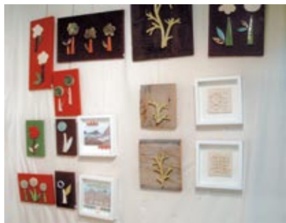
Stands 53-54 Charo Cimas