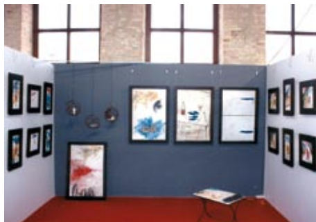
Stands 55-56 Íñigo Dueñas