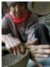
“Pottery from ethnic minorities in Southwest China” de LU BIN

Se propone como en ediciones anteriores el recinto de Proyecciones de la Feria de Cerámica como lugar de proyección. Contando además con una jaima instalada a continuación para proyecciones artísticas sobre las intervenciones en Embarrarte2011