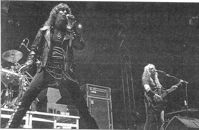
El vocalista de Medina Azahara, Manuel Martínez, en una imagen de archivo en Leganés.