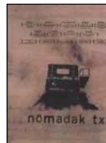
DVD Edición Limitada